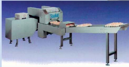
Staalkat 102S 14400 munaa tunnissa.