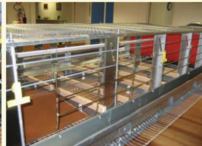
Triotec Tape 136/16