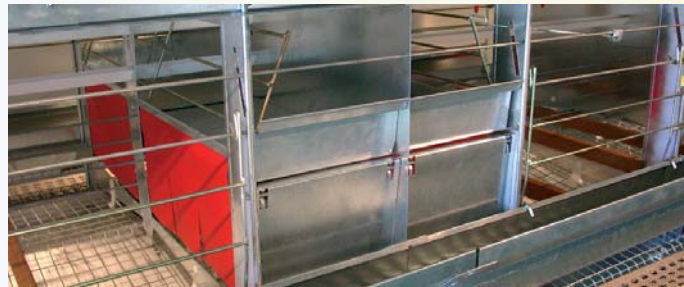
Triotec Tape 136/8 virikehäkki

Tape virikehäkimallistomme on uudistunut. Perinteisen Triotec Tape 136/8 mallin (8 kanaa/lokero) rinnalle olemme kehittäneet edullisemmän vaihtoehdon Tape 136/16 (16 kanaa/lokero). Kanamäärän optimoimiseen olemme julkaisseet kaksi leveämpää virikehäkimallia: Tape 150/20 (20 kanaa/lokero) ja Tape 180/25 (25 kanaa/lokero). Tape 180/25 virikehäkki on markkinoiden kustannustehokkain virikehäkimalli. Perinteisesti uskotaan virikehäkkeihin siirryttäessä kanamäärän putoavan n. 20% verrattuna varustelemattomiin kanahäkkeihin. Tape 180/25 mahdollistaa kanamäärän pitämisen samana tai parhaassa tapauksessa jopa kasvamiseen, mikäli tuotantolaitokseen on mahdollista lisätä yksi kerros häkkeitä lisää (esim. 3 m hallissa kolmesta kerroksesta neljään kerrokseen.). Virikehäkeissä kanoilla on käytettävänä pesät, orret, kuopsutustilat ja kynsiviilat. Kokonaispinta-ala kanaa kohden on 750 cm 2 . Häkkikerroksia voi olla 3, 4, 5 tai 6 rakennuksen korkeuden mukaan. Tape virikehäkeissä on säilytetty perinteisen Tape häkin varmatoimisuus ja helppokäyttöisyys. Pieni rehunkulutus, puhtaat munat ja alhainen särömunamäärä ovat aina kuuluneet Tape häkkien perusominaisuuksiin. Tervetuloa tutustumaan mallistoon tiloihimme.