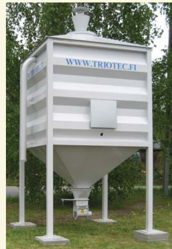
Triotec neliosioit. Puupelletin varastointiin. Koot 6,5-30,5 m 3

TRIOTEC-SIILLOISTA, kun siilojen toimitus viimeistään 31.3.2009 mennessä.