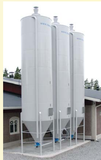
Triotec ulkosioit. Koot 9-62 m 3 . Sopivat sekä rehulle että puupelletille. Puhallustäyttö. Miesluukku ja tarkkailuikkunat kyljessä. Poistoilma-syklonissa lintuverkko. Helppo asennus, kuljetus-automme nostaa valmiin siilon paikoilleen.