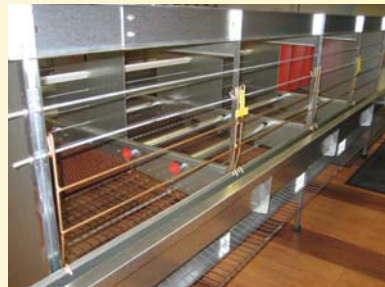
Triotec Tape 150/20